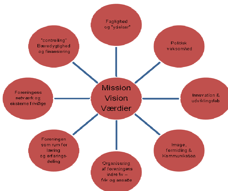
Figur 3: Opgaver i en forenings arbejde

Bløderforeningens arbejde er med til at påvirke den enkelte bløders livskvalitet. Mange af de aktiviteter, foreningen gennemfører, har fokus på empowerment blandt medlemmerne. Dette ses særligt i det fokus, der er på at skabe ny viden samt arenaer for overførsel af læring, som også af den enkelte bløder fremhæves som afgørende for identitetsskabelsen.